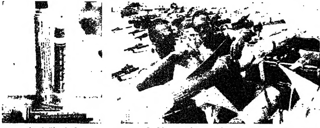
جنديان اميركيان يشعان المسمات الاخيرة على صواريخ جو - جو في قاعدة جوية سعودية

الحجيان: العراق حشد ١٥٠ ألف جندي على الحدود السعودية والمملكة تؤوي ١٠٠ ألف لاجئ كويتي